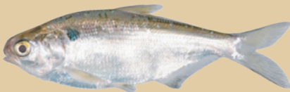
Sábalo molleja ( nativo )